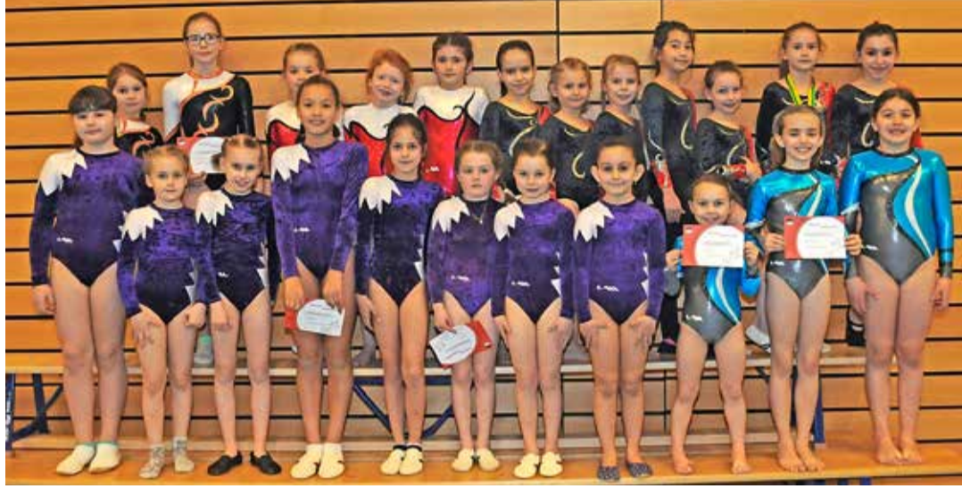
Les gymnastes des quatre sociétés broyarde engagées dans le concours C1 disputé à Saint-Aubin.

Des mouvements exécutés avec sérieux et concentration, mais conclus par des sourires jusqu'aux oreilles. Les gymnastes en lice samedi dernier à Saint-Aubin pour le championnat nord aux agrès, plus de 200, y ont mis tout leur cœur. Pour les unes, il s'agissait même du premier concours, de quoi mettre enfin en pratique les éléments appris durant les entraînements. Pour d'autres, un peu plus aguerries, l'enjeu était de remporter une distinction ou de composer leur ticket pour la finale cantonale fribourgeoise qui aura lieu le 19 mai à Bulle.