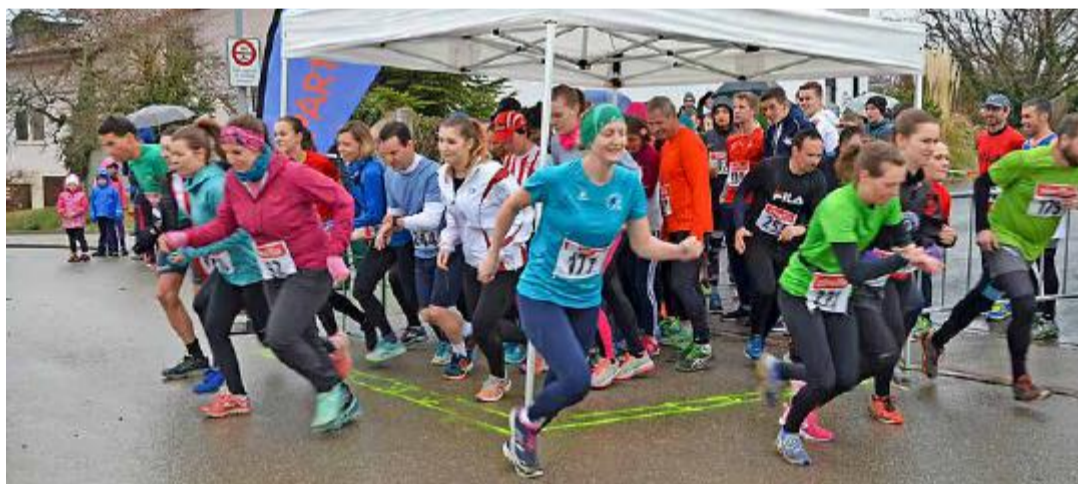
Coup d'envoi de la course des adultes: c'est parti pour une petite trotte en terre corçaline.

Les coureurs ont afflué samedi dernier du côté de Corcelles-près-Payerne où la société de gym du village organisait la 2 e manche du championnat Broye-Jorat de cross. Disputé chaque année à cette période, ce championnat permet aux sociétés de gymnastique de la Broye vaudoise et du Jorat de se rencontrer et se mesurer dans un esprit fair-play et bon enfant. Les jeunes sont particulièrement à l'honneur puisque ce sont eux qui sont les plus nombreux à porter haut les couleurs de leur société.