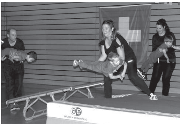
Le groupe parents-enfants a réalisé des performances aériennes

La société de gymnastique de St-Aubin a offert deux représentations fort réussies vendredi et samedi derniers au centre sportif de St-Aubin. A l'occasion de ses traditionnelles soirées de gym, ce sont plus d'une dizaine de groupes qui ont présenté un spectacle aliant prouesses gymniques et artistiques. Ce ne sont pas moins de 250 membres de la gym qui ont émerveillé le public venu en nombre lors des deux soirées.