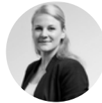
Déborah Resp. archives/médias