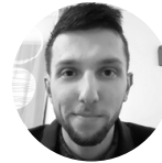
Noah Resp. manifestation