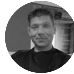
Claude Resp. matériel